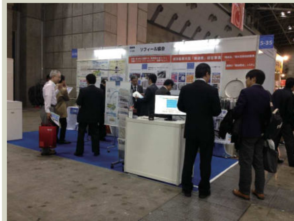
エコプロ2016 「環境とエネルギーの未来展」