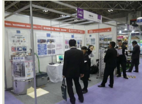
新価値創造展2016「第12回 中小企業総合展 東京」