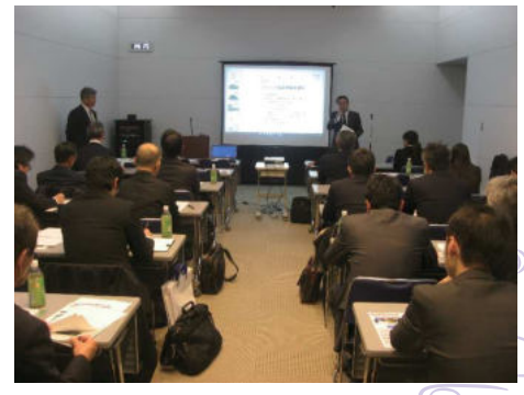
ソフィール協会事務局

研修会では展示をしている新連携の取り組みとしての「コンテナ・ソフィール」と「雨水処理機」の発表他、ソフィールの取り組みとして環境省環境技術実証事業(自然地域トイレし尿処理技術実証試験)の進捗状況報告などをさせていただきました。研修会後は、エコプロの見学を行いました。今後も協会では研修会を開催し、ソフィールの普及と新しい取り組みにチャレンジしていきますので、宜しくお願い致します。