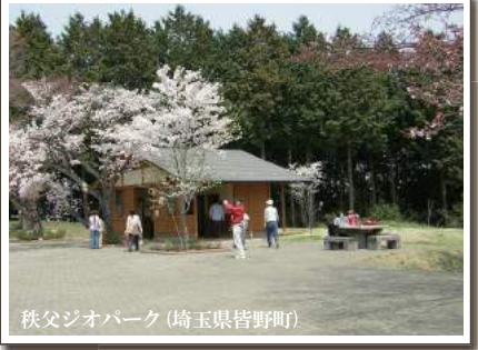
秩父ジオパーク(埼玉県皆野町)

平成27年11月3日から18日(現地時間)の日程で、ユネスコ本部(フランス)で開催された第38回ユネスコ総会において、これまでユネスコの支援事業として行われてきた世界ジオパークネットワークの活動が、『国際地質科学ジオパーク計画』として、ユネスコの正式事業として認定されました。 ジオパークは、地質や地形などの地球活動の記録を保全して研究教育に生かすとともに、地質や地形のなごりたちやそれらと人の暮らしの関わりを実感して楽しむところから、世界遺産と同じ正式事業への格上げで国内外での認知度が高まり、観光・教育面での活用に弾みがつくと期待されています。 世界ジオパークは洞爺湖有珠山(北海道)や隠岐(島根県)、阿蘇(熊本)など国内8箇所を含め、世界33ヶ国で120箇所が認定されています。 その国内版で日本ジオパークが31地域あり、それらの地域の内5箇所がソフィールが導入されています。