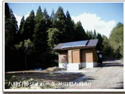
八峰白神ジオパーク(秋田県八峰町)