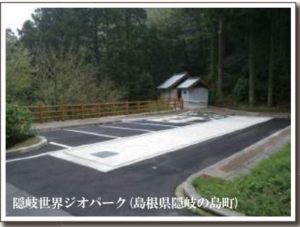
隠岐世界ジオパーク(高知県隠岐の島町)