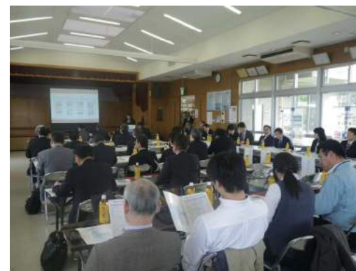
糸満市内施設にて

3月17日は関係者のカンファレンス方式の合同会議を行い、参加者が産学官の垣根を超えた自由な意見交換や質疑応答により、今後の事業戦略構築へ反映できる会議となりました。