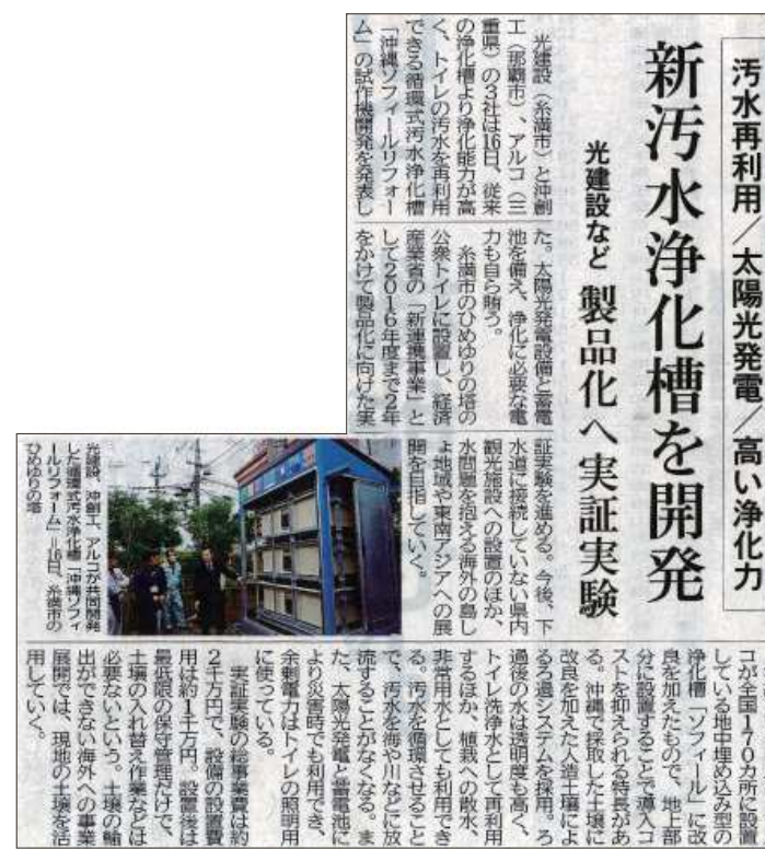
平成28年3月17日(木)「琉球日報」掲載