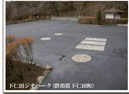
下仁田ジオパーク(群馬県下仁田町)