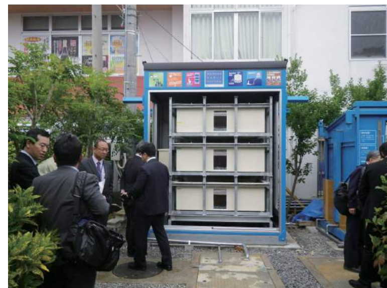
沖縄オリジナルソフィール 新試作機

中小企業基盤整備機構沖縄事務所、三重大学、立命館大学、台湾企業及び国内企業から50名の参加を頂き、ひめゆりの塔に設置したソフィールを改良した地上設置型装置、太陽光発電&蓄電池システム、雨水貯留装置、遠隔監視システムの試作機を視察して頂きました。