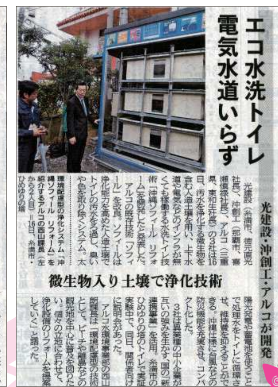
平成28年3月17日(木)「沖縄タイムス」掲載